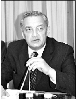
გია ვოლსკი, რომელიც ახლახანადაა დაბრუნებული საქართველოში, მსოფლიოში ცნობილი პოლიტიკოსია.

გაზაფხულის მოხვამ კოალიციის "ქართული ოცნება"-ს ახალი იმედი. მათი იტალიის განხილვისთვის სეზონი იწყება. პოლიტიკური განვითარებაში ახალი საპარტიო ბრუნვა დაიწყო.