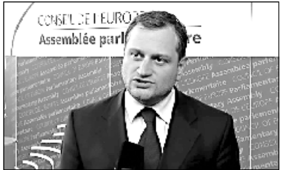
გია ვოლსკი, რომელიც ახლახანადაა დაბრუნებული საქართველოში, მსოფლიოში ცნობილი პოლიტიკოსია.

...არაკორექტულობაში აღნაგობებს. ვოლსკი აღნიშნავს, რომ ახვლედიანის განცხადებაში არაა ნათქვამი, რომელიც უნდა იყოს კანდიდატი. ვოლსკი აღნიშნავს, რომ ახვლედიანის განცხადებაში არაა ნათქვამი, რომელიც უნდა იყოს კანდიდატი. ვოლსკი აღნიშნავს, რომ ახვლედიანის განცხადებაში არაა ნათქვამი, რომელიც უნდა იყოს კანდიდატი.