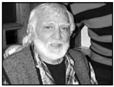
ოთარ კობერძის ოჯახს, მეგობრებსა და ახლობლებს, ქართველ მკურნალებს.

მისი ცხედარი დიდუბის პანთეონში დაკრძალვამდე რამდენიმე საათით ადრე გადასვენდა. ხაღვალ სამიქაძე პანთეონში მივიდა. მისი თქმით, ოთარ კობერძე დიდუბის პანთეონში დაკრძალეს.