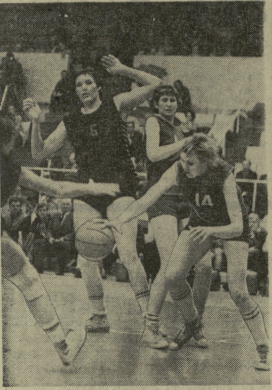
საქართველოს სახელმწიფო უნივერსიტეტის სტუდენტები

ერთდროული თამაშის სენსი, რომელიც 18 და 14 მაისს დიდოსტატმა მ. ტალმა ჩაატარა რვა დღეზე, მეტისმეტად უჩვეულო იყო. მსოფლიოს ექსპერტები მოსკოვის ცენტრალური საკადრეო კლუბიდან ეთამაშებოდა ავსტრალიის საუკეთესო მოქალაქეებს, რომელთა შორის იყვნენ კანბერის ჩემპიონი კრასკე, ახალი სამხრეთ უელსის ჩემპიონი ლაურინი, ავსტრალიის ყოფილი ჩემპიონი ჰამილტონი, მათი თხოვნით ტალი თამაშობდა იმ დროს, როცა ავსტრალიაში უკვე დღე იქნებოდა, მოსკოვში კი შუალაშე გადასული იყო პირველი სვლა