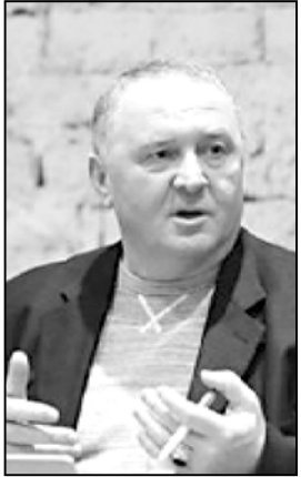
ემზარ ჯაბარანი ინვესტიციების