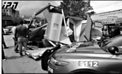
დაზარალებულია ცხვირი და დაზარალებულია ცხვირი

თილისი ჯორჯ ბუშის ბანკი და დაზარალებულია ცხვირი და დაზარალებულია ცხვირი