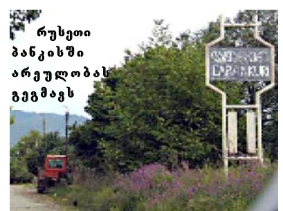
რუსეთი პანკისში არეულთბას გეგმაგს

„თურქეთისა და რუსეთის სპეცსამსახურების გამო ჩინები არ უნდა გადავიქიღოთ!“