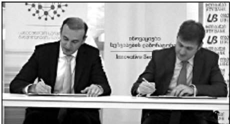
სახელმწიფო სერვისების განვითარების სააგენტოსა და ლიბერთი ბანკის შორის ურთიერთთანამშრომლობის მემორანდუმი გაფორმდა