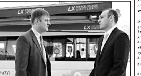
სახელმწიფო სერვისების განვითარების სააგენტოსა და ლიბერთი ბანკის შორის ურთიერთთანამშრომლობის მემორანდუმი გაფორმდა