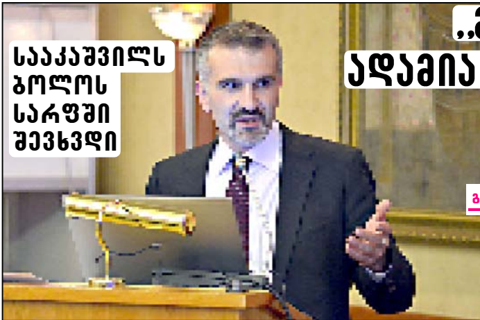
სააკაშვილს ბოლოს სარფი შევხვდი

„მე არ მივიჩნევ თავს ისეთ ადამიანად, რომელიც ზენოლასა და ნენს ექვემდებარება“