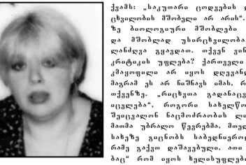
უტყობო სხეულში მათი ხრადის ვერ აღიარებულს, სამართალმცოდნეობის დამცველებმა...