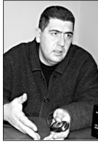
ფურცლის მიდოდნენ სისამართლოში. იქ ეწევა, ვინ შთორ უნდა დეხეხოთ. მათ არც მტკიცებულებების მოთხოვნა მოუთხოვეს და არც სხვა მსგავსი. ახალი ბეჭედი მანდელი პროკურორის, მათ კვალდისფერობისა და წესიერებაზე დაბარებულ უნდა იყოს...