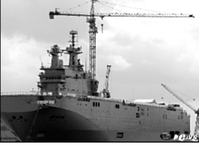
ლე დრიანმა ახვევ განაცხადა, რომ რუსეთისთვის „მიწრაფის“ გადაცემის შედეგად სტრატეგიული ხასიათის ატრეზია და უკრაინაში რუსეთის სამხედრო აგრესიის უკავშირდება.

რუსეთის წინაშე ვალდებულებების შესრულებებისთვის კი საფრანგეთი უნდა არის, 1,2 მილიარდი ევრო გადაიხადოს. ამასთან, საფრანგეთის თავდაცვის მინისტრმა კონტრაქტის შედეგად აშშ-ს უსვიაჯა, თუცა, ამერიკის თავდაცვის მინისტრ უტონ კარტერსთან პაუზა არ მუდგა.