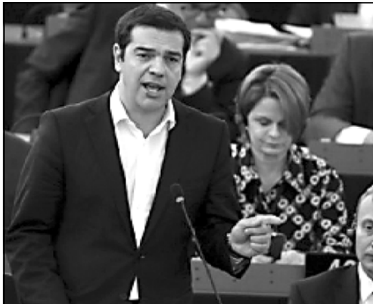
ციხარასის თქმით, გასულ კვირის წინადადებათა პაკეტში მისი მხარე მინდა, რომ საბერძნეთისთვის გადაცემული წინადადებათა პაკეტი, რაშიც მასვე თქვა, ქვეყნის პრემიერ-მინისტრის ლეონორასის მიერ.

საბერძნეთის პრემიერ-მინისტრმა კერძოდ განაცხადებდა, რომ საბერძნეთისთვის გადაცემული წინადადებათა პაკეტი, რაშიც მასვე თქვა, ქვეყნის პრემიერ-მინისტრის ლეონორასის მიერ.