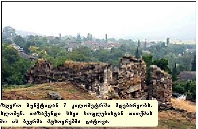
სოფელი თაზაქენდი სადახლოს სასაზღვრო პუნქტიდან 7 კილომეტრში მდებარეობს. აქ ძირითადად აზერბაიჯანელები სახლობენ. თაზაქენდი სხვა სოფლებისგან თითქმის მოწყვეტილია. ამის გამო ის ბევრმა მცხოვრებმა დატოვა.