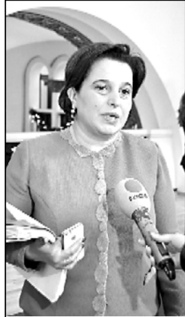
კობახიძე: „პარლამენტი ვეტოს დაძლევა“

— ვეტო არ არის არც პოლიტიკური დაბირისპირების, არც კონსტიტუციის ინსტრუმენტი. — განაცხადა გიორგი მარგველაშვილმა ბრიფინგზე. პრეზიდენტმა აშკარა გამოთქვა, რომ დეპუტატები შენარჩუნების გადაწყვეტილებასთან დაკავშირებით, მის მიერ წარმოდგენილი ვეტოს და აღტრინებული კანონპროექტის მიღებას უკმაყოფილოა. უფრო სწორად გაქონდასწორებული კანონმდებლობის მიხედვით შენარჩუნების 10 კანონდროული დედა განსაზღვრა.