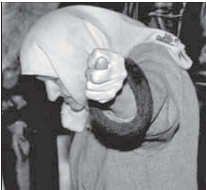
მთავრობამ მორიგი ტყუილი უამოკავაპარა

გაბგაბებინეთ, ბატონებო, რას გვთავაზობთ, 7 პროგრამას თუ საღღებრძელოს?