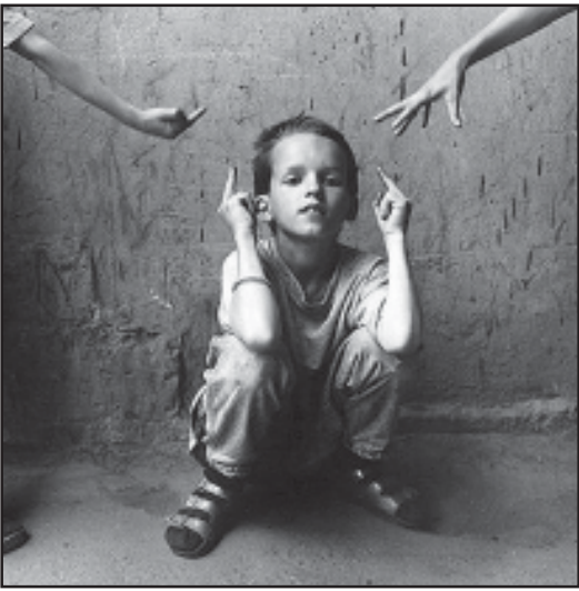
რა ვითარებაა ამ