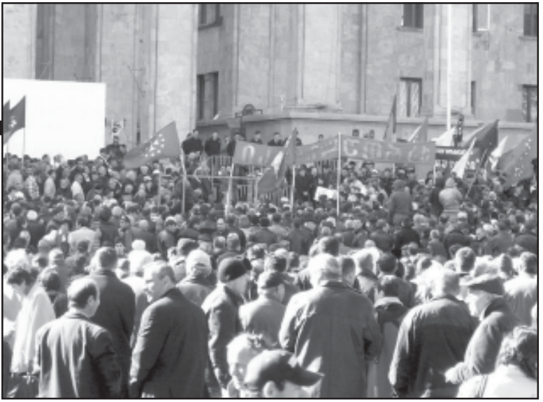
მაშხვალის სამოქალაქო საზოგადოება 26 თებერვლაგვით, ხოლო ცენტრალური საბრძოლველი კომისიის მარტის შუა რიცხვებში შექმნილი მტკიცე პირობა არ მიიციანო, მაგრამ შემდეგ დაანათა, ჩემი სიტყვა ისეთი, ზედმეტი ფიცი-მტკიცე არ სჭირდებაო.