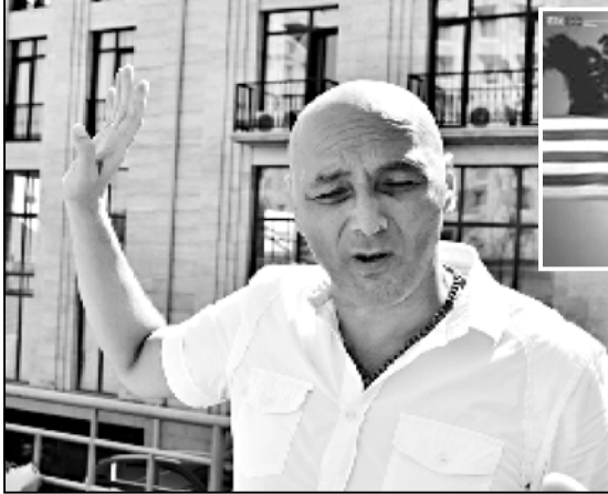
„ეს ხელისუფლება უნდა შეიცვალოს“