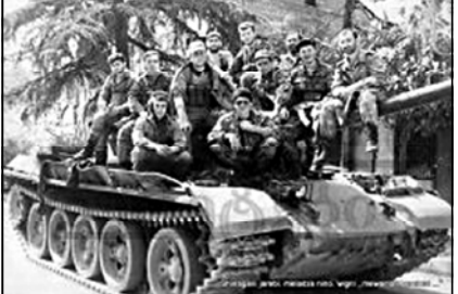
აფხაზები ავტომატური ხელისუფლებას წინააღმდეგობას აწევენ...