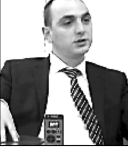
— ბატონო ზურაბ, რა კომენტარს გააკეთებთ ქალბიძის განხორციელების თაობაზე? — ბატონო ვტყვი, რომ ქადაგიძის განცხადებაში ხაზოტყის ნიშნები იგრძნობა.

ნები იგრძნობა. კერძოდ, რომელიც ეკონომიკის განვითარებას ხელს უწყობს. კერძოდ, რომელიც ეკონომიკის განვითარებას ხელს უწყობს.