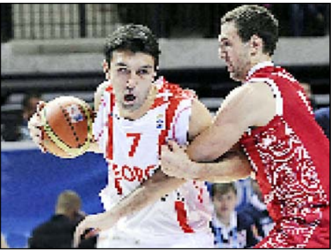
სვლა აქვს უფრო გამოცდილი და დაკვირვებითი გახდა, კარგ მწვრთნელთან მიუწია კარგად...