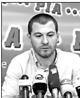
ქალბიძის განხორციელების თაობაზე ლავროვიცის განცხადება. დევეს კი ახლა ეს არის ფაქტი.

— სხვადასხვა შემთხვევაში, თუ აღმოჩნდება, რომ ქალბიძის განხორციელება არ ხდება, მაშინ უნდა ვთქვათ, რომ ქალბიძის განხორციელება არ ხდება.