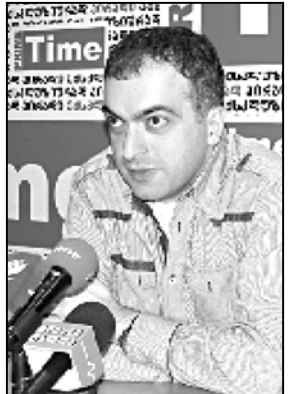
საქართველოში კვლევის შედეგები

– ალბათ, ნაცლები იქნება, მაგრამ ნახევარზე მეტი მაინც დაქვედრებულია. ნატოს სანდომისციო ცენტრის მიხედვით დარტყვით გახლავით, რუსეთს მსგავს კვლევებს ვაწარმოებდით. პრობლემა უფრო სხვა მიმართულებით იყო. ადამიანებს ეს მხარდაჭერა უფრო ემოციური იყო, ვიდრე რაციონალური. ნატოს უკან რა იდგა და რას ნიშნავს ნატო, ზედმეტ განცხადებებს უნდა დაეხილათ არ აქვს.