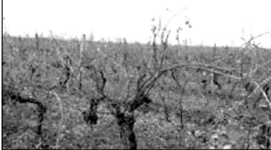
შინ სეცვას შედეგად მიყენებული წარ-ადი ხამჯერ დიდა. მათ შორის როგორც ინფორმაციის კუთხოიაცა, ასე-ვე სიფელს მუწონების კუთხოიაცა.

დის დაზღვევის მნიშვნელოვანი ნაწილი, ასევე 14 მაღალიც ფარგლებში დაჯ-ვა სეცვას საწინააღმდეგო სისტემა, თითო ჰექტარ დაახლოებით, 300 ევრო ჯდება და, ხაეროდ ჯამში, ეს ვაქო-და ამისთვის, რომ ხალხმა მაქსიმალ-რად დაზღვევის და მნიშვნელოვ იყოს რისკები დაფარავს. თუქია არც სტი-ქის საწინააღმდეგო სისტემა არ გა-ხეობა 100%-იანი გარანტი, ასეო რამე არ არსებობს, ეს შეადგება 80-90%-იანი პრევენციის საშუალება იყოს და.