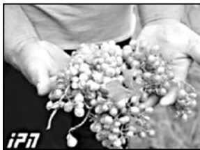
წარადი თვლიან, წარადი კი ხაქმოდ დიდა. მოსახლეობის წარადის შეხა-ხებ განცხადებ შექაქეს, ენახით, რას იზამენ.

— ჯერ არავის არ შემოთავაზე-ბია დახმარება. როგორც ამბობენ, ჯერ