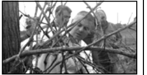
პექტრამდე ვენახი ხამჯერ დაისტიქვა. სავარჯული კომპანია „არაში“ მისი წარადი 30%-ით შეაღინა. წუხინდელი სტიქის წარადიზე კი რაზმაბის საღა-რეკვიო კომპანიაში განეიტრადე ჯერ არ გავიკრებია. იგი აბარებს, სიფელეკვიო კომპანიაში კვლე ამართობს.