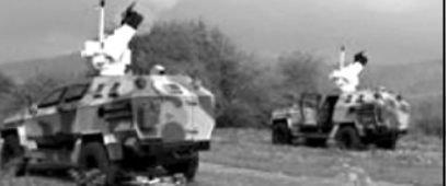
ხამხედრო ხამქონიერე-ტექნიკური ცენტრი „ღელტა“ კახეთში სეცვასთან ღაკაპირკობით განცხადებს აგ-რეცელებს. „ანტერნესიუსი“ განცხადებს უიდელოდ ვაი-გაზობთ.

„ღელტა“ სეცვას საწინააღმდეგო სისტემის მარ-თვის ცენტრის შიერ 19 აგვისტოს 17:30 სი-დან კახეთის რეგიონში ხამხედრო-დახაველი მიმართულბიდან დაიქ-სინდა შემოპეკავი დრუბლის ფორნტი, დრუბელი თავა-პირველად გავრცელდა სავარჯის ტრინორიაზე, შემდეგ კი თვლიას რაიონის ხამხედრო ნაწილს და გურჯაანში.