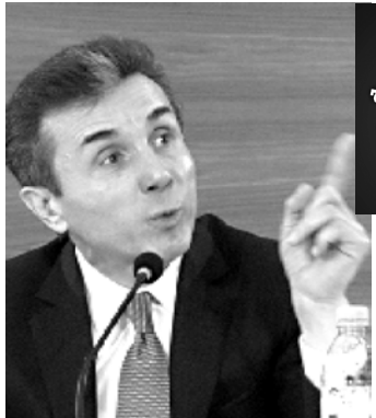
მათ დახამალი არაფერი აქვთ. ეს ინფორმაცია ყველაფრის ღია და საჯაროა.

პარტიოთა აღიანსს კახა კუკავას პარტია მოჰყავს 30 ათას ლარანი შემოწმებული. ინტელი ალხანას უნდა იცნოს ვერაფერს ხელახს იმაში, რომ კერძო ბიზნესი მათ პარტიას ფულს სწირავენ. როგორც ზურაბ აბაშიძე „ახალ თაობასთან“ საუბარში აღნიშნავს,