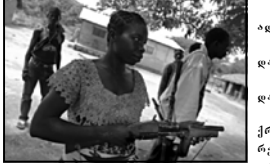
შეიარაღებული ფორმირებები შორის დაპირისპირების ცენტრალური ავრკიონ რესპუბლიკაში