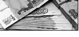
რუბლის კურსი დაბლა მოვიდა