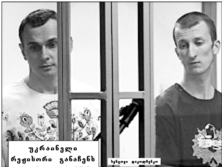
უკრაინელი რეჟისორი განაჩენს ერთგული შიხმის სიმღერით შესხვა

სენსოვი ფრ-ხიხლავს არ ყინდა. შინ შირტიკამ გაუკეთა ორბანიბება ადვიში შიქალედი უკრაინე-ვი ფორმირებებს სურხათით შიხდროვების. ამან რუსების წინსხვა გამოიწვივა. ერო ხაჯარის სენსოვის უცნობმა კვლავისმიწოდებდა დღეული: — ყინმის რუსეთისთავის გადვიშია ვადაწვივა-