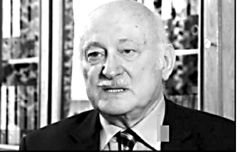
საქართველოს ელექტროენერგეტიკის კომპანიის ხელმძღვანელი...