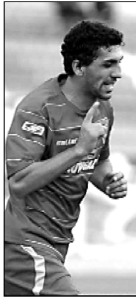
დარწინელ ვუთხეში სტუმრებს და კურდღლებით თამაშს და მტორებს ანგარანის შეცდვის შანსი არ დაუტოვეს.

მა-30 ვუთხე მასხინძეებს ხაჯარაძის დარტყმის შემდეგ ანგარანის გათანაბრება, მაგრამ შეეწყინა კო უხადლე თამაში და დარტყმული ბურთი კუორხურზე მოთვერდა. ვორელებმა 84-ე ვუთხე ვერტლი დახვე აღწინა შედეგად. ამჯერადვე გოლი მოეძინა შეტევაში, რომელიც ნავალოცკი კარგად ნაწილობრივ ბურთი მიმტრე შეკარგულია გადავიდა კარში - 0:2.