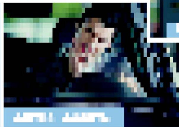
DAVID J. PHILLIPS

THE NEW YORK TIMES DAVID J. PHILLIPS BY THE EDITORIAL BOARD