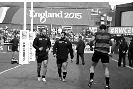
კავშირშია მთავარი ბაგშეების ტრენერების საბაზისი.

საქართველოს მორაგებთა ნაკრები ტონგასთან გამარჯვების შემდეგ სამწრთელი შტაბის ერთი დღის დასვენებას ითხოვდა, თუმცა ინგლისელი ბაგშეები სიმსივნით დააგადებული მორაგებების მწვერული ქვეყნის მთლიანობის დაცვას ითხოვდა. მათი მთავარი მოთხოვნა იყო ინგლისელი ბაგშეების მორაგებების მწვერული ქვეყნის მთლიანობის დაცვა.