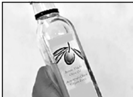
კომპანია „ჯეოლიპი“ რამდენიმე წელია, საქართველოში ზეთის ნაკრავს იწყებს. მნიშვნელოვანი საქართველოს ზეთის ნაკრავს იწყებს.

მნიშვნელოვანი საქართველოს ზეთის ნაკრავს იწყებს. მნიშვნელოვანი საქართველოს ზეთის ნაკრავს იწყებს. მნიშვნელოვანი საქართველოს ზეთის ნაკრავს იწყებს.