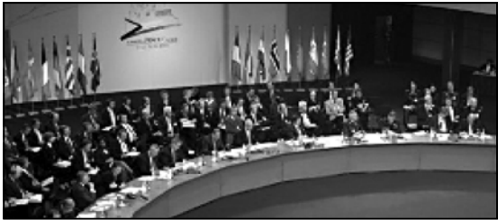
ნატოს გენერალური ასამბლეის საბოლოო რეზოლუციის დაფიქსირება, რომელიც უკრაინის განუყოფელი ნაწილია.

ნატოს გენერალურმა ასამბლეამ უკრაინის მხარდამხარი რეზოლუცია მიიღო. რეზოლუციის ნაწილია, რომ ნატო სელდინობის უცხადებს უკრაინის დამოუკიდებლობისა და ტერიტორიული მთლიანობისთვის ბრძოლაში. ბუნდესტაგის დელეგაცია შევიდა, ამას წინ ადგილობრივი, გერმანიის წინააღმდეგობა პოლიციის, საფრანგეთისა თუ სხვა ქვეყნების მხარდამხარი გადართა. ამის შემდეგ გერმანიელმა მოსახლეობამ, რეზოლუციის მიხედვით ერთმანეთს შეკრება წარმოუტანდა დამთავრდა.