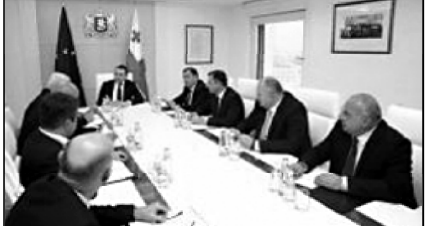
ღარჩიაშვილი სახელმწიფო რეზერვების შესახებ განაცხადებს.

საქართველოს პრეზიდენტისგან ირაკლი ღარჩიაშვილმა სახელმწიფო რეზერვების შესახებ განაცხადა. მისი განცხადებით, სახელმწიფო რეზერვების შექმნის მიზანია, ქვეყნის ეკონომიკის განვითარების ხელშეწყობა და მისი მდგრადი განვითარების უზრუნველყოფა.