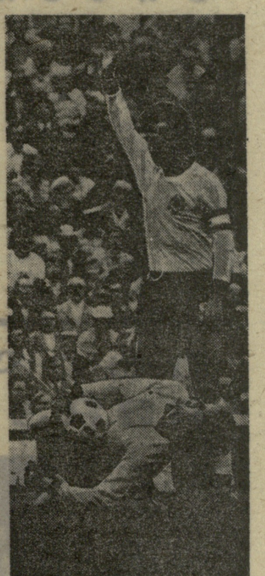
ს უ რ ა თ ზ ე: ასეთია თამაშის დროს ბეკენბაუერი — მშვიდი, საკუთარ ძალებში და რწმუნებული, გუნდის სული და გული. აი ახლაც, მეკარე მაიერიც აიღო ბურთი, ბეკენბაუერი კი თავისი გუნდის წევრებს ანიშნებს — ყველაფერი წესრიგშია.

მაგრამ როცა კრუფი სრული ძალით თამაშობს მინდორზე, ეს შეუდარებელი, დიდებული სანახაობაა. ზევით ჩვენ ვლაპარაკობდით ბეკენბაუერის ორგანიზატობაზე, პრაქტიკულად, მებრძოლ თვისებებზე. კრუფი სულ სხვაა. კრუფის თამაში — სისარულია, სიმსუბუქეა, სიამოვნება. სცადეთ მისი დაჭერა: იგი ერთთავად მოძრაობს, რაღაც ჰამპკური აღმაფრენა ახლავს თან. ეძებს ბურთს, ეძებს ახალ სვლებს, ახალ გარტყეობას, წამით არ დაუყოვნებს გადაცემას პარტნიორს და ამავე დროს შუძლია რამდენიც სურს ატაროს ბურთი. არავინ იცის, რას მოსაზრებს მი-