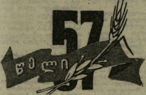
გ. იაშვილის ნახატი.