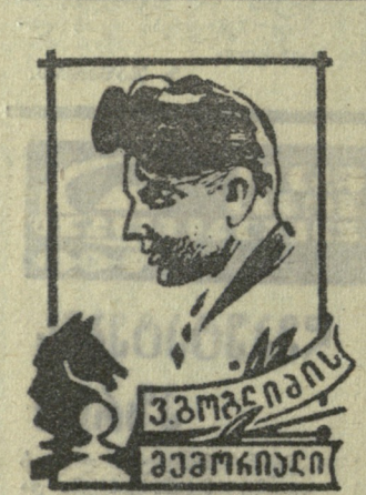
თბილისი - 74