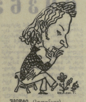
შმიდტი (პოლონეთი). შ. შანიძის ნახატი.