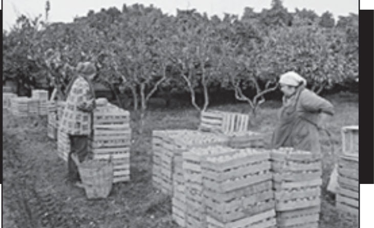
სეზონი რა წილი უკავია სამუშაოებს, რომლებსაც არის ის უზრუნველყოფილი პროფესიული კადრებით?

აბსოლუტურად უმუშევრობის დასაძლევად, ვინაიდან ვალუტის გაძვლისას უცხოური ვალუტის ფონდების განხორციელება თანხებს იწვევს. სამაგიეროდ, კაპიტალის ექსპორტი უფრო ხელსაყრელია, ვინაიდან იძენება უცხოური ვალუტის შედარებით იაფად