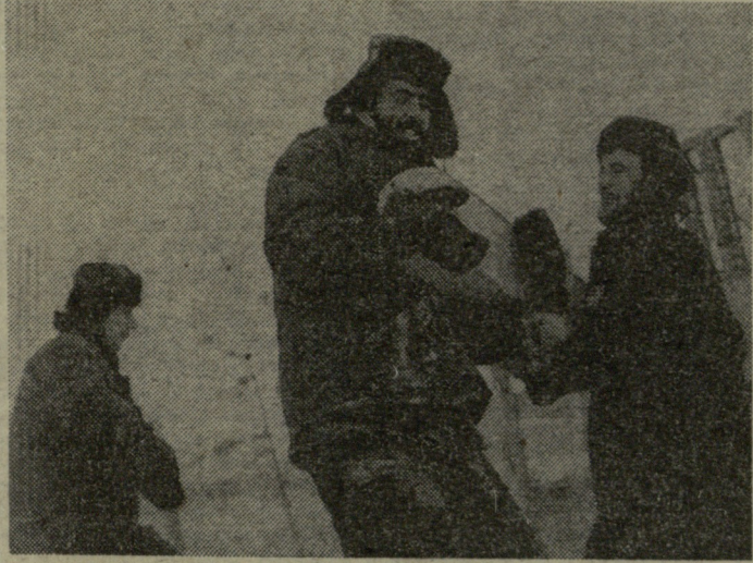
პროლეტარეთ ყველა ძეგენისა, შერტოდით!