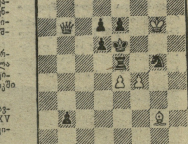
შამათი სამ სვლაში

რ. თაპარიანი (თბილისი) ძღწვად სსრ კავშირის ქალთა 37-ე ჩემპიონატის გამარჯვებული — მ. ჩიბურდანიძე, 5. ალექსანდრის, 5. იოსელიანს.