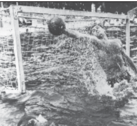
სპორტულ კლუბ „ივირია“