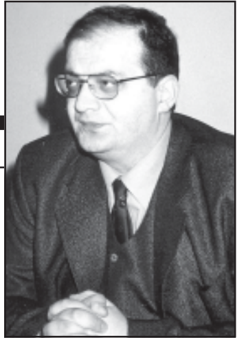
მდგომარეობაშია სასამართლო ხელისუფლება, საპარტულ-დაცვაში სისტემა.

სიტუაციას უფრო ამძიმებს ის, რომ უნდოვლობა ხელისუფლებას და ხალხს შორის კიდევ უფრო ღრმავდება. თუ ეს პროცესი როგორც არ შეჩერდება ან რაიმე გადაწყვეტილება არ იქნა მიღებული, კიდევ უფრო გამწვავდება და ეს კატასტროფას გამოიწვევს