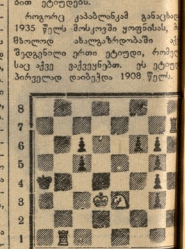
მაცხო 2 სულნი