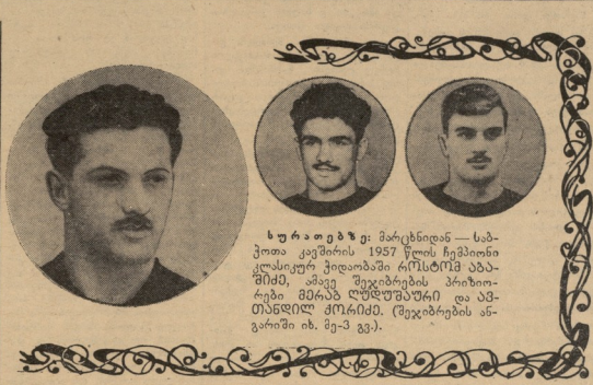
სურათებში: მარცხნივ — სამხრეთ კავშირის 1957 წლის ჩემპიონი ვლადიმერ ჯილაშვილი, ცენტრში — პრიორი-1950 წლის ჩემპიონი ივანე თაყაიანი, მარჯვნივ — მსოფლიო ჩემპიონი ივანე თაყაიანი.

ყველაზე უფრო ხშირად დატოვებული ბავშვების მოვლა უნდა იყოს საზოგადოების ყურადღების მიქცევის საგანი. მათთვის უნდა იყოს საკმარისი საშუალებები.