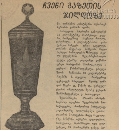
მისი დღეების კოპიატული წყნად... მისი დღეების კოპიატული წყნად...