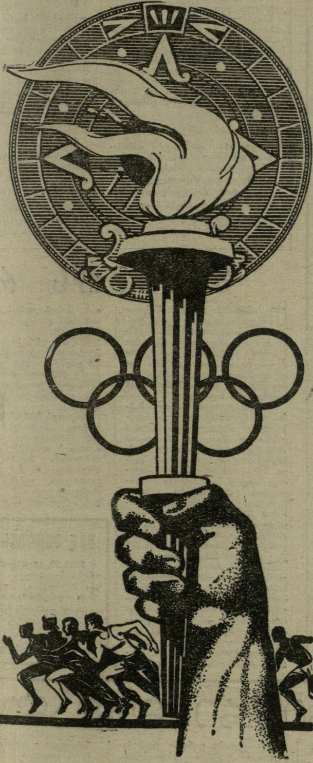
ნან. გ. იაშვილისა.

ა. კოსიბინი, სსრ კავშირის მინისტრთა საბჭოს თავმჯდომარე.