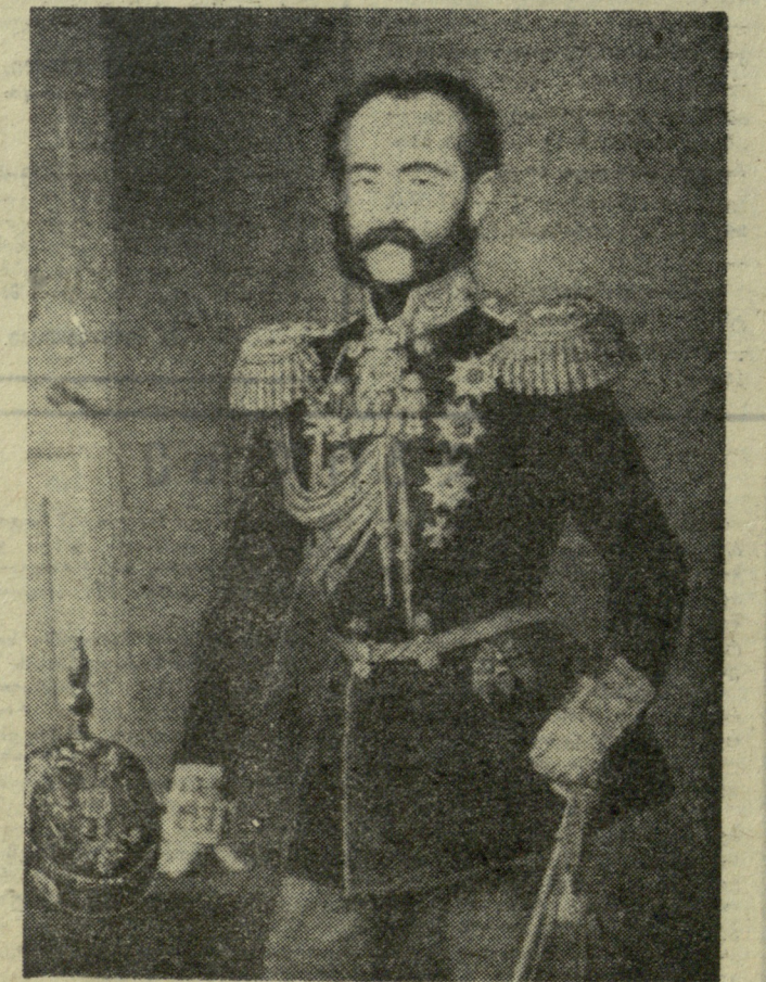
ანდრია დადიანის უკანასკნელი სურათი, რომელზეც იგი რუსეთის არმიის გენერალ-ლეიტენანტის საპარადო ფორმაშია აღბეჭდილი. სურათი ქვეყნდება პირველად.

ანდრია დადიანის მარტოხელა კა-ცი იყო. როგორც ჩანს, თავს ვერ