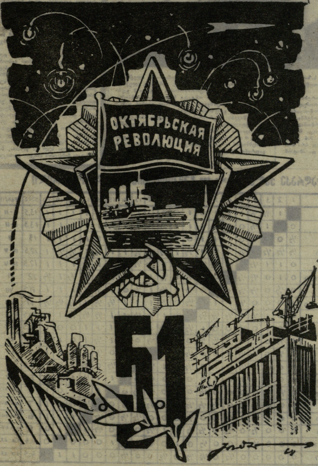
ნახ. გ. იაშვილისა.

პოლო, XIII ტურის წინ მოწინავეთა ჯგუფში ასეთი მდგომარეობაა: სსრ კავშირი — 27,5 ქულა, იუგოსლავია — 28,5, აშშ — 27, ბულგარეთი და გერ — 28,5-28,5, უნგრეთი — 24,5, არგენტინა — 23 (აქ აღნიშნული არ არის ამ ტურში გადაღებული პარტიების რაოდენობა).