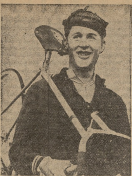
მან წინა მოსკოვი დამარჯვებული სპორტისტი იყო. მისი წინა მოსკოვი დამარჯვებული სპორტისტი იყო. მისი წინა მოსკოვი დამარჯვებული სპორტისტი იყო.