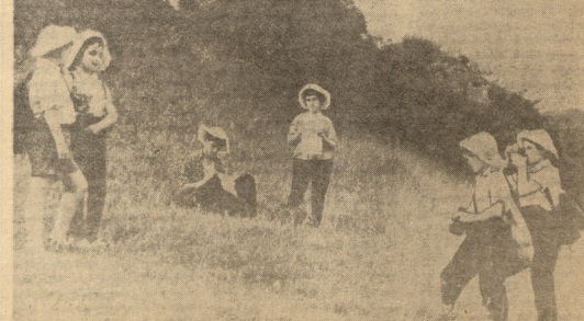
სარაშტი სოფლის ტურისტების მიერ გადაღებული ფოტო

დღის პირველი პიჯეტი და სხვაობის მოკლე ადგილს წარმოადგენს ნაწარმოებებს მწიგნობრობის და პირდაპირი უფროსების უფროსების წარმოადგენს.