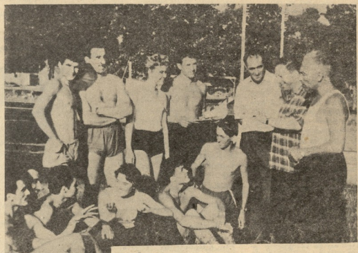
ს. მ. პირიძის სახ. პრაქის კალთაბეთის დაზრდული გლეხები

13,65 მ; 3. ტბულუ — 13,29 მ; 4. ჩხეჲ — 13,15 მ; 5. კობეაძე — 12,23 მ; 6. სტარატი — 11,70 მ; 7. სანაძე, 8. ჩხეჲ — 11,09 მ; 9. მატეიჲი (თბილისი, გან. ვანა) — 10,81 მ; 10. გოგია (თბილისი, კოლმუხრან) — 10,80 მ. სეილი. 1. ივალაძე — 4333 მუღი; 2. ანაშინი — 4084; 3. რაჰა-ბდოი — 4052; 4. სტარატი — 3630; 5. აფხაზიშვილი — 3790; 6. მატეიჲი — 3758; 7. ზოიკოე — 3715; 8. სანაძე — 3690; 9. ზურაბიშვილი — (თბილისი, გან. ვანა) — 3543; 10. მათაშვილი (თბილისი, სურჯულაღა) — 3500.