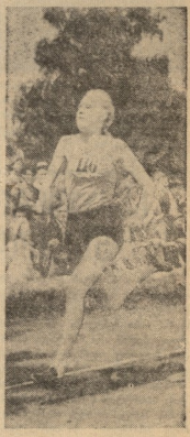
მკლვობელთა თასის მფლობელები... სანიჰარის დანიშნულება არაა...