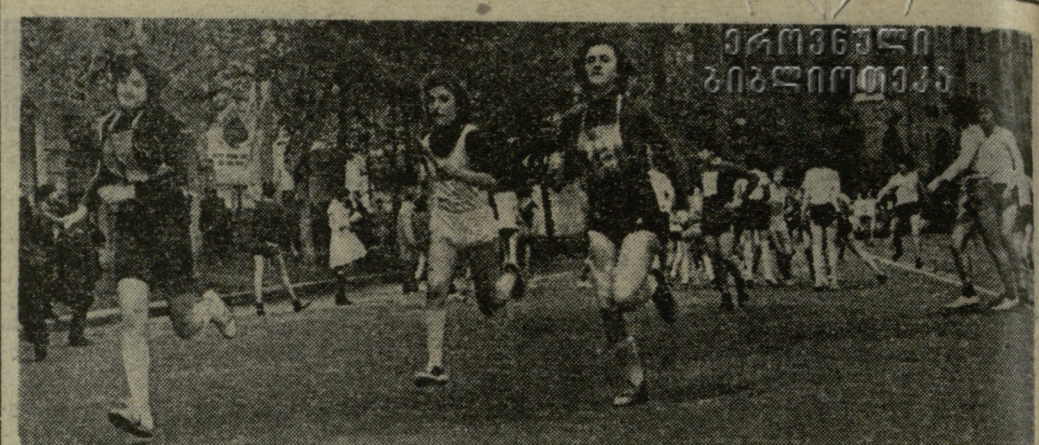
ამას წინათ თბილისის სპორტკომიტეტის ინიციატივით დედაქალაქის ქუჩებში გაიმართა მოსწავლე მძლეოსანთა ამანათრბენი, რომლის ტრასა მელქიშვილის ქუჩიდან ლენინის მოედანამდე გრძელდებოდა. სურათზე: ამანათრბენის ერთ-ერთ ეტაპზე.

დასავლეთკარაგანალა სპორტსმენმა ქალმა პ. რეპსერმა ოლიმპიადა 72-ის დედაქალაქში გამართულ შეჯიბრებაზე შუბი 61,28 მეტრზე ტყორცნა.