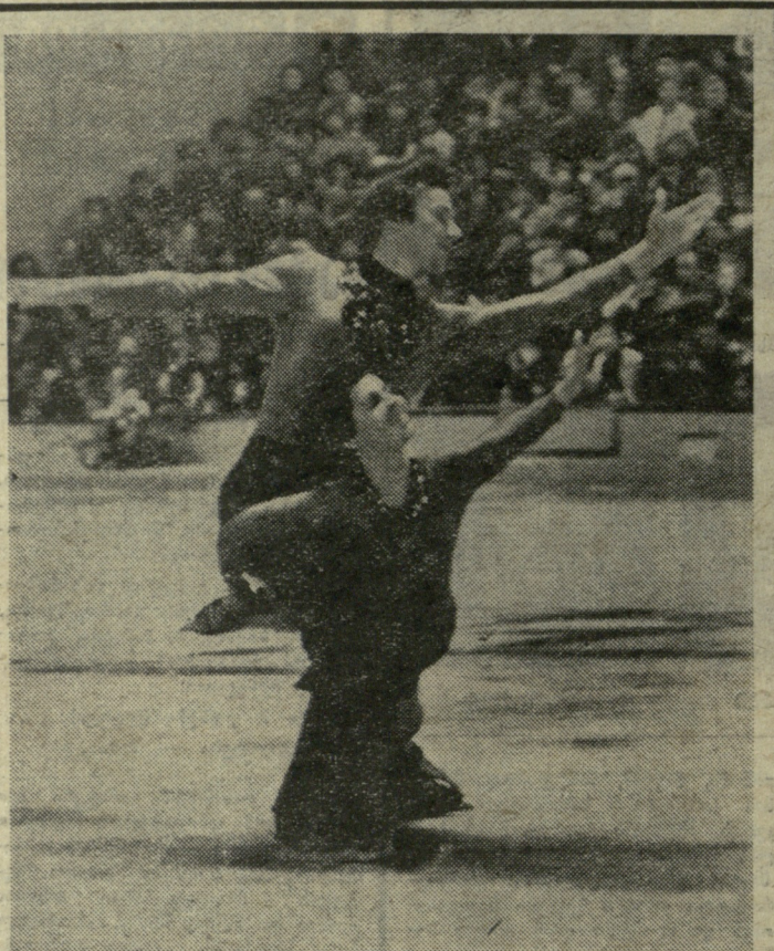
გაზინე თბილისის სპორტის სახანძროში დაიწყო და დღეს მთავრდება სსრ კავშირის ფიზკულტურის სრიალის უძლიერეს ოსტატთა საჩვენებელი გამოსვლები.

გაზინე მოსკოვში გაიმართა „სპორტლოტოსა“ და „სპორტლოტო-2“-ის მორაგე, მეცხრამეტე ტიპაჟი. აი, ილბიანი ციფრები და სახეობები: „სპორტლოტო“: 4, 5, 27, 36, 38, 41. შედეგათიანი ბურთულა — 35. „სპორტლოტო-2“: 10, 17, 19, 20, 23, 24. შედეგათიანი ბურთულა — 11.