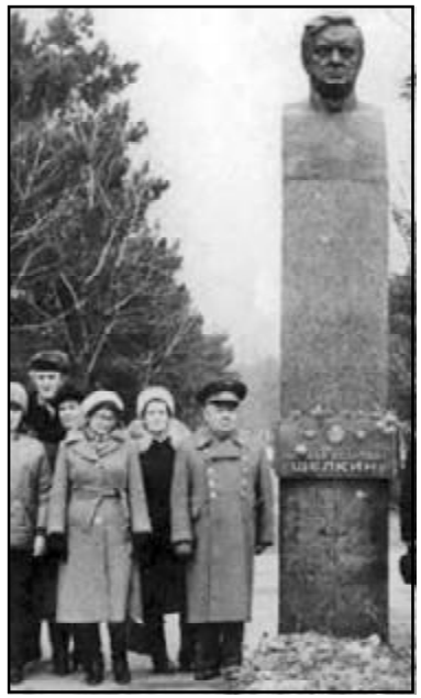
ასე გამოიყარაბო-და კირილ შროლკინის ძეგლი, რომლის ილაგა თბილისში, თამარაშვილის ქუჩაზე ფიზიკის ინსტიტუტის შენობასთან.

დედაქალაქში. საინტერესოა, სად წაიღეს? სამწუხაროდ, ქალაქ თბილისის მერიამ გერაფრით აგვისნა მისი გაქრობა“. ვაზეთი არაერთგზის დაუბრუნდა ამ თემას. ამჟამად მკითხველს ვთავაზობთ ინტერვიუს ცნობილ მეცნიერთან, აკადემიკოსთან, ვინაც იდგა „სსრ კავშირის ატომური პროექტის“ სათავეებთან, ასტროფიზიკოს ჯუმბერ ლომინაძესთან, რომელიც ბირთვული ფიზიკის გამოჩენილ მეცნიერთან შროლკინთან მუშაობდა. რუს მწერალთან, ამ ცოტახნის წინათ გამოცემული წიგნის – „ატომური საუკუნე. ბომბი“ – ავტორთან ვლადიმირ გუბარევიან საუბარში მეცნიერმა განაცხადა, რომ აუცილებლად მოჰკიდებს ხელს მსოფლიო სახელის მქონე ჩვენი თანამემამულის ძეგლის აღდგენას.