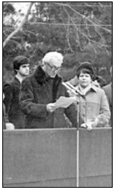
აკადემიკოსი ჯ.ლომინაძე და ფილიქს შროლკინის ძეგლი, კ. ი. შროლკინის ბიუსტის გახსნის დროს მის სამშობლოში, თბილისში. 1982 წ.

2009 წლის 25 ნოემბრის ვაზეთ „გეგერნი ტბილისში“ სათაურით „რა დააშაგა ბატონმა შროლკინმა?“ დაიბეჭდა ინფორმაცია „სკვერიდან თამარაშვილის ქუჩაზე, რომელიც თბილისში ფიზიკის ინსტიტუტთანაა, გაქრა 1982 წელს დადგმული კირილ ივანეს ძე შროლკინის ძეგლი. ქანდაკების ავტორია გ.თომიძე, არქიტექტორი – გ.ჩიჩუა. კირილ ივანეს ძე შროლკინი „სსრ კავშირის ატომური პროექტის“ ისტორიის ერთ-ერთი საკვანძო ფიგურაა. ის „თბილისელი ბიჭი“ იყო, დაიბადა თბილისში 1911 წლის 17 მაისს, ბიჭუნა დარბოდა მის უსწორ-მასწორო ქუჩებში, სამეზის მინიჭებული აქვს სოციალისტური შრომის გმირის წოდება. ამიტომ დაიდგა მისი ძეგლი ჩვენს