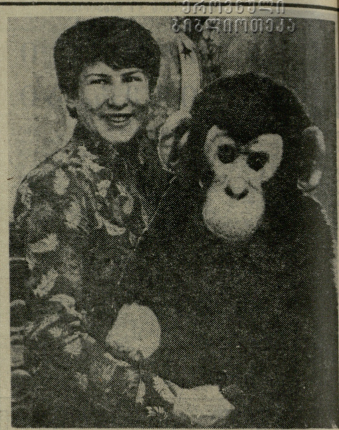
სპორტის მოყვარულთათვის კარგადაა ცნობილი ელენე ვაიცეხოვსკია. მონრეალის ოლიმპიურ თამაშებში მან ოქროს მედალი დაიხსოვრა 10-მეტრიანი ტრამპლინდან წყალში ხტომაში. ამაჟამად ელენე ინტენსიურად ემზადება მოსკოვის ოლიმპიადისთვის. სურათზე: ე. ვაიცეხოვსკია თავის საყვარელ სუვენიერთან ერთად.

დამთავრდა სოფლის სპორტსმენთა III სასაფხულო თამაშების პროგრამით გათვალისწინებული „კოლმეურნის“ ცენტრალური საბჭოს პირად-გუნდური პირველობა თავისუფალ ჭიდაობაში. ასპარეზობდნენ აფხაზეთის, აჭარის, სამხრეთ ოსეთის, მხარბაძის, ონის, კასპის, ზუგდიდისა და სხვა რაიონების წარმომადგენლები. გუნდურ ჩათვლაში პირველ