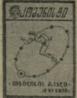
„კომუნისტის“ მედიის ტრადიციული