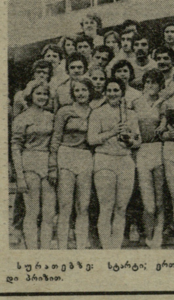
სურათებზე: სტარტი; ერთ-ერთ ეტაპზე; „კომუნისტის“ გუნდი პრიზით.