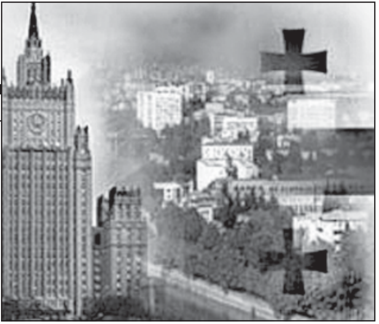
ზვირ განცხადებაზე შორს არ მიდის. არც ერთი სახელმწიფო, მათ შორის აშშ, არ გაიფუჭებს ურთიერთობას რუსეთთან სხვანაირი მხარდაჭერით ჩვენდამი. უკანასკნელი 15 წლის ისტორია აგას ალსატურებს. მსოფლიო რუსეთის მხარდაჭერა რომ გვქონდეს, დღეს უფრო ახლოს ვიქნებოდით ქვეყნის ტერიტორიულ მთლიანობის აღდგენაზე ოცნებაზე შედეგითა. ჩვენით რა რუსეთთან ცივ ომში, უკვე წინასწარ მოგანერეთ ხელი ჩვენი კაპიტალიზაციის აქტს!

ლოც დიდ სახელმწიფოს – რუსეთს, „პარის მიზნულ“ უფრო მეტი სტრატეგიული ინტერესები რომ ჰქონდეს საპარტეზლოში, ამის შესახებ კითხვის დასვაც კი ვერაზალოც იტოვება და შეიძლება ერის მოლაშქრად გამოაცხადონ კითხვის ავტორი. რა ჩვენი საშემა რასურს რუსეთს, ვინ ჰკითხავს რუსეთს ჩვენი სტრატეგიული ინტერესების შესახებ? იმისი სიტყვით, ჩვენმა პოლიტიკოსებმა ელიტამ რუსეთში იღი ხანი, „ჩამოწრა“ ანაბრიში და და ამ ქვეყნად მისი არსებობა ჩვენი მსოფლიო მისი დასაძვით იბრძობა. ან ასეთი სახელმწიფოთა შორის ურთიერთობის ჩვენი პოლიტიკური ელიტისთვის ბავაბა, პოლიტიკა და დიპლომატი. ყოველივე ამის შემდეგ კარგს რას უნდა ველოდეთ რუსეთისაგან?