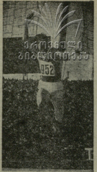
ეროვნული გიგანტობრძე 952