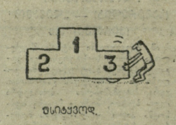
ფსიხიკოლოგი. ა. ოქროპირიძის ნახატი.