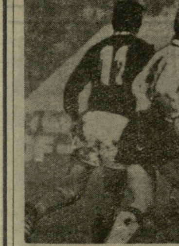
ბანგლილ ზაფხულს პრალაში შედგა საინტერესო საერთაშორისო მატჩი ფეხბურთში ჩემპიონოვკისა და გერმანიის ფედერაციული რესპუბლიკის ნაკრებს შორის.