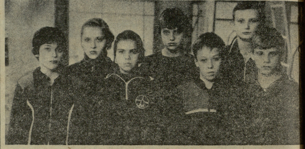
რესპუბლიკის პარტიულ-სამეურნეო აქტივისტების გადაწყვეტილებით მოამბედავი

ტემა ვიდრე ერთეულ ცხადვეს, რომ რუსთაველი მოცურავეები ყველა ასაკობრივ ჯგუფში კლასიკურ მხარე კონკურენციას გაუწევინებდა თბილისელებს. ეს კი არაა და, უკვე ამჯერად მასპინძელთა უპირატესობა აშკარა იყო, მათ 521 ქულით I ადგილი დაიკავეს. II ადგილსთვის ბრძოლა ძირითადად თბილისელ და ბათუმელ მოცურავეებს შორის გაჩაღდა. საბოლოოდ დედაქალაქის სპორტსმენებმა 396 ქულით II ადგილი დაიკავეს. მათ 8 ქულით ჩამორჩნენ ბათუმელები, მეოთხე იყო ქუთაისის გუნდი — 342 ქულა. შეჯიბრებაში მონაწილეობდნენ ჰეათურელი მოცურავეებიც, რომლებმაც 33 ქულა მოაგროვეს.