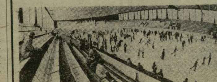
სხვათა შორის, მ. ჩიხლაძე ერთ-ერთი უდიდესი მომთხვენლობა საკუთარი თავისადმი ძვირფას ფანტასტიკურ გამარჯვებებს...